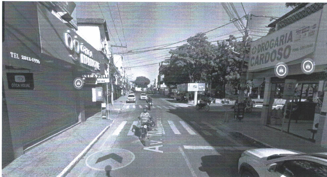
CRUZAMENTO (PROXIMO A PRAÇA CASTRO ALVES – CENTRO).