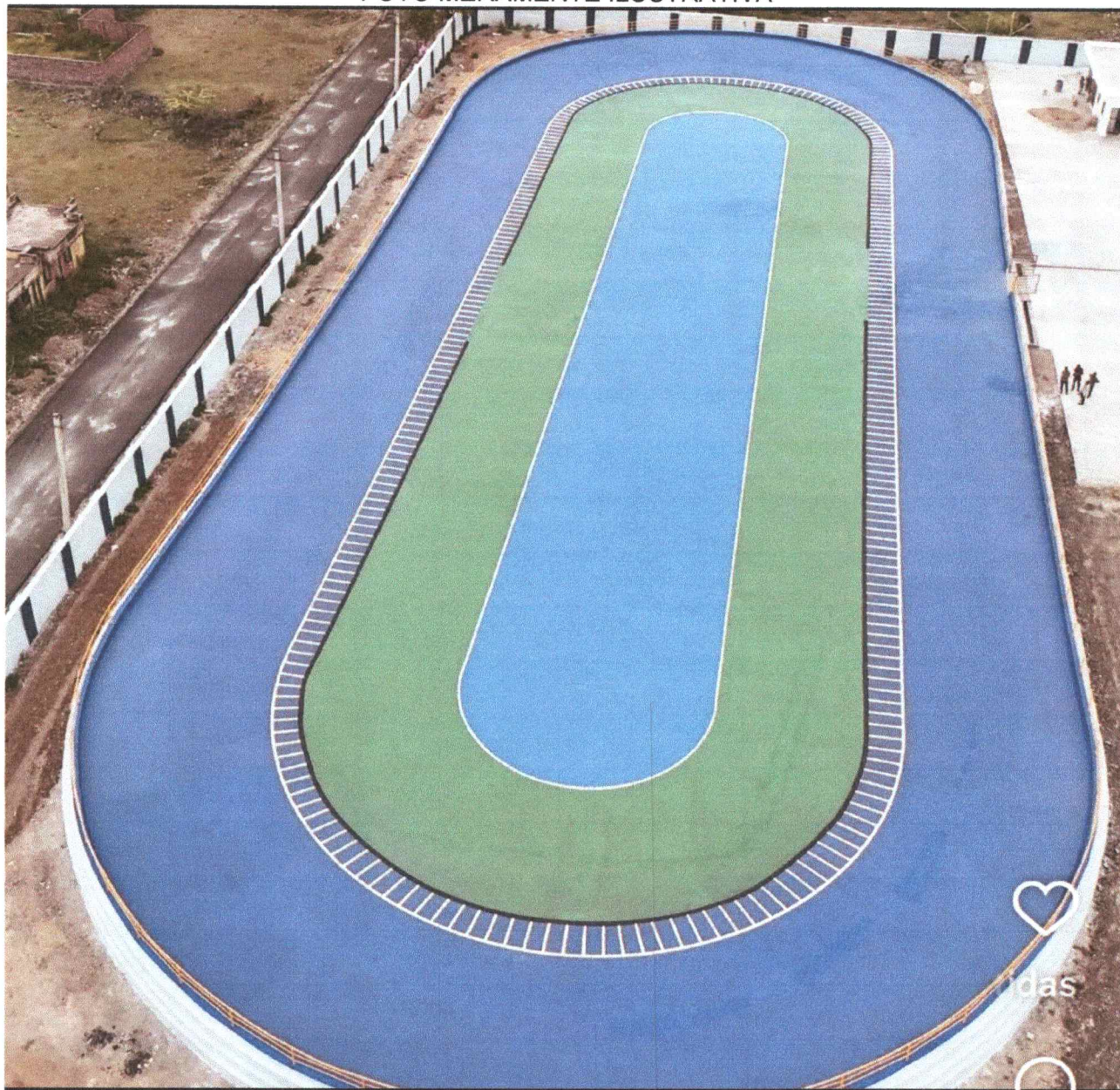
PISTA DE PATINS E CICLISMO DE ALTA VELOCIDADE