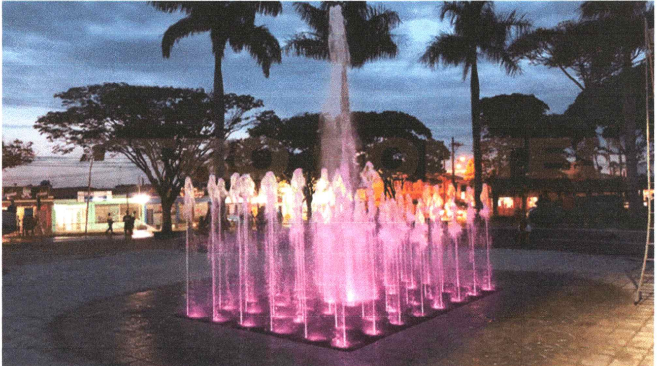
FONTE LUMINOSA, FOTO MERAMENTE ILUSTRATIVA