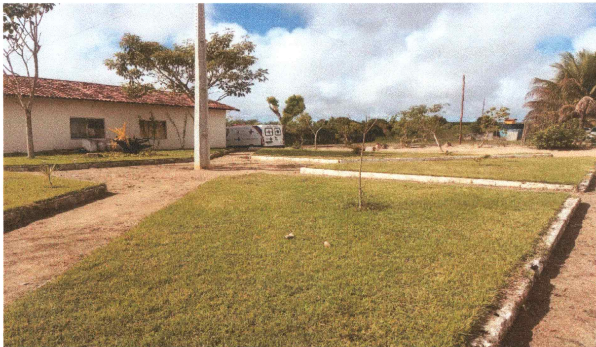
Praça José Altino